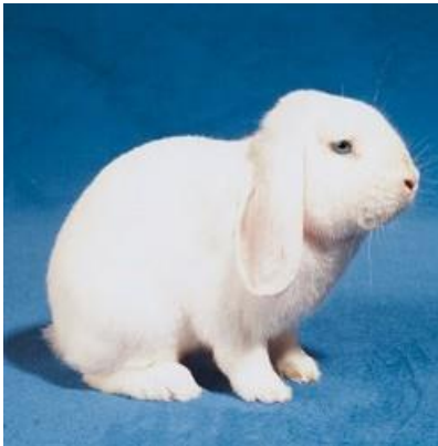
Blanc aux yeux bleus