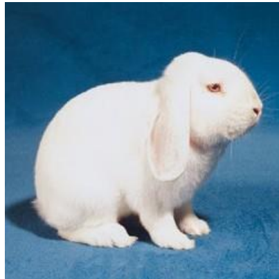
Blanc aux yeux rouges